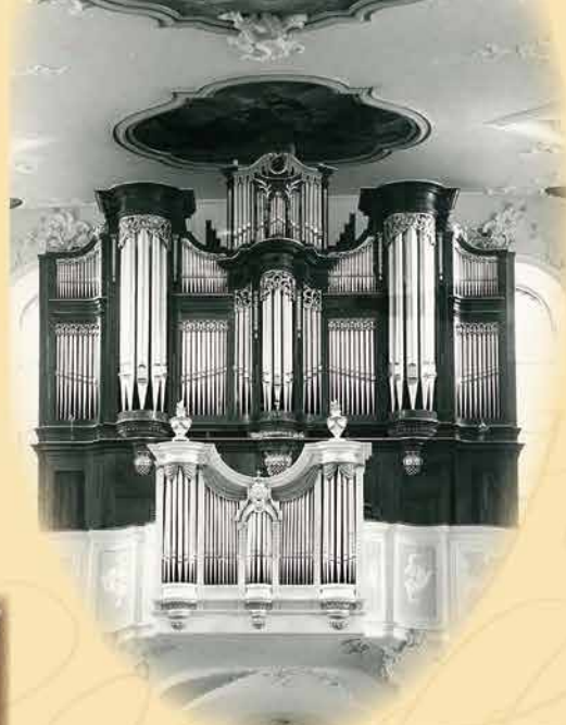
◀ ORGEL UM 1961

Unter Pfarrer Steiger bekam die Orgelbauwerkstätte W. Schwarz und Sohn aus Überlingen im Januar 1914 den Auftrag für ein pneumatisches Instrument zum Preis von 13.674 Reichsmark. Das alte Eichengehäuse sollte erhalten und seitlich erweitert werden. Die Arbeiten wurden zügig durchgeführt, da die neue Orgel schon am 15. August 1914 erstmals gespielt wurde. Dies geht aus einer