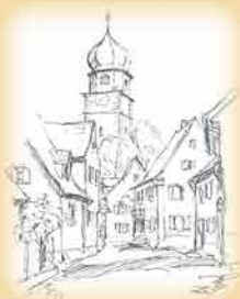
Pfarrei Mariä Himmelfahrt Kirchhofen